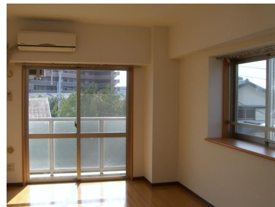
9.1畳の広い洋室 シャンプードレッサー キッチン1口ガスコンロ