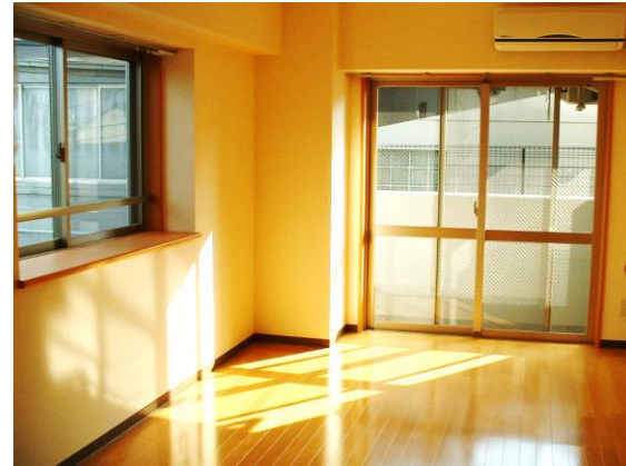
9.1畳の広い洋室 シャンプードレッサー キッチン1口ガスコンロ